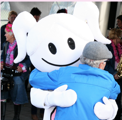
HOLD ONTO H-O-P-E

geen geld krijgen omdat er grote sommen geld zijn gereserveerd voor meerderjarige projecten waarbij gelden jarenlang onaangetast op een rekening staan terwijl er elke dag 9 vrouwen overlijden aan de gevolgen van borstkanker. Dit is onacceptabel en dit moet veranderen. Tijd is kritiek. Als iemand die jij lief hebt, goed kan worden behandeld door snel te handelen, dan wil je niet wachten op gelden die vast staan ergens op een bankrekening. Toch?