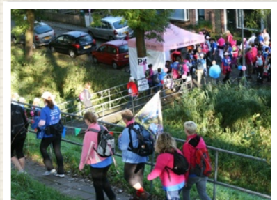
PIT STOP DAY 2