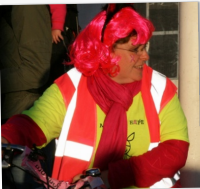
SAFETY & CLEANUP CREW